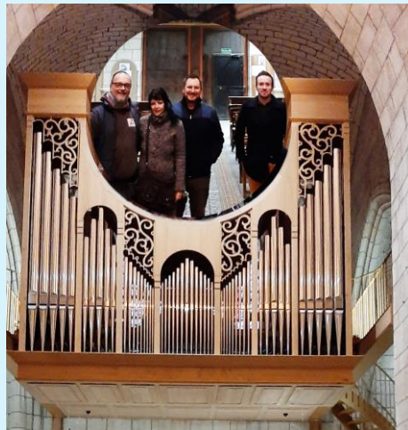
L'équipe « Orgue De Facto »