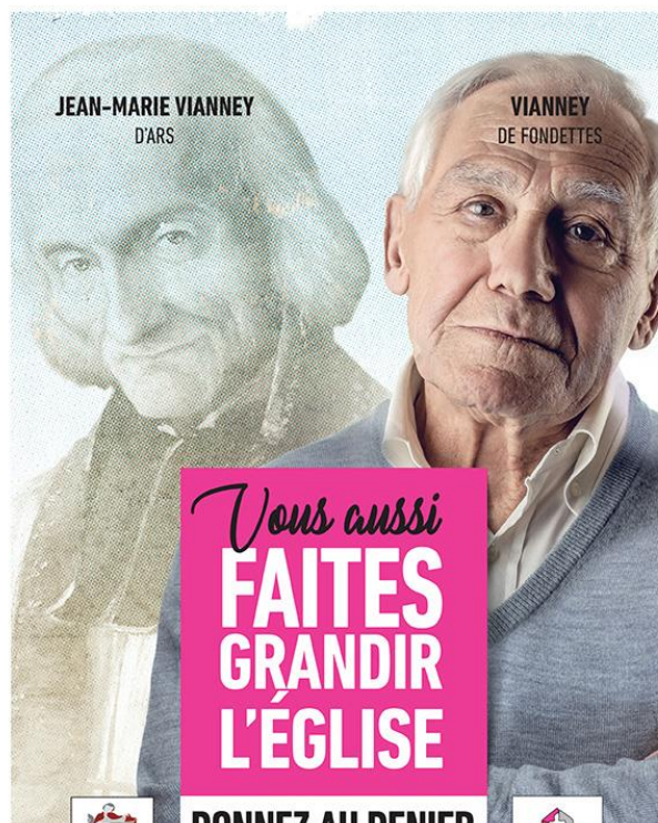
JEAN-MARIE VIANNEY D'ARS