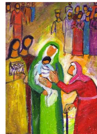
Evangile et peinture.com

Le 2 février, fête de la Présentation de Jésus au Temple, mieux connue sous le nom de fête de la Chandeleur, commémore l'évènement relaté par l'évangile selon St Luc : Marie et Joseph allant présenter Jésus enfant au Temple, selon la coutume juive, 40 jours après sa naissance.